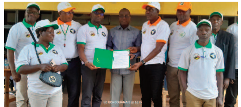
La grande équipe de combattants de la FOPROCAM, artisans de la labelisation