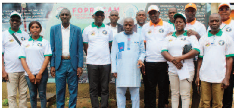
Photo de famille après la visite du Ministre, Gouverneur dans les locaux de la FOPROCAM