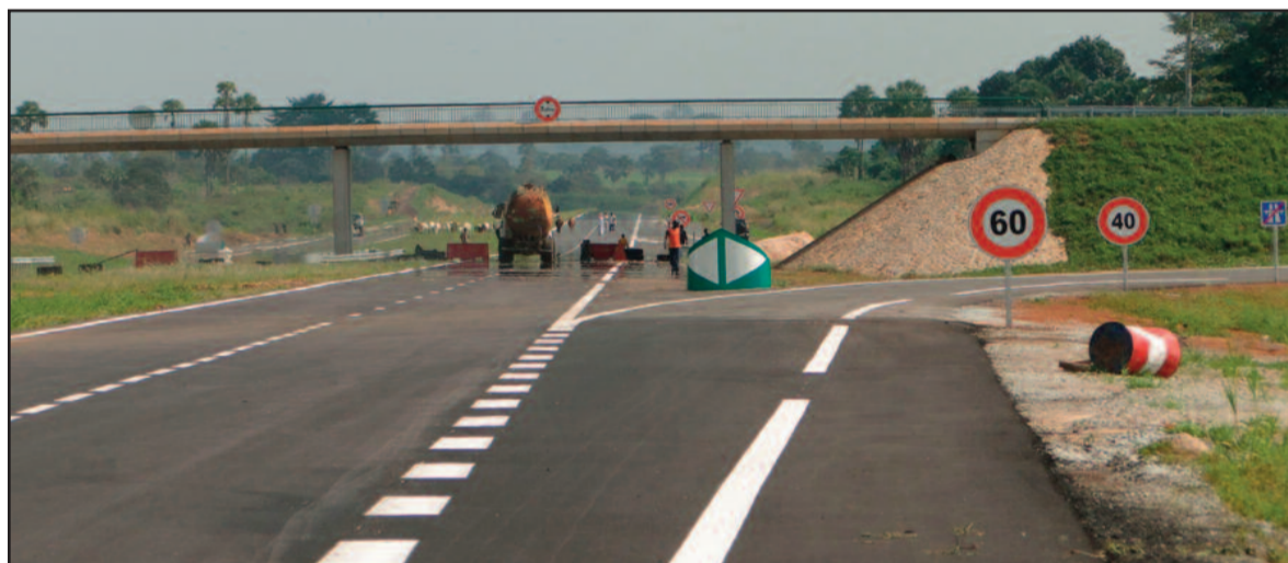
La route précède le développement dit l'adage.