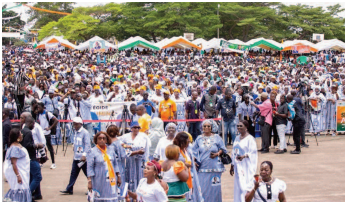
Grande et belle mobilisation des femmes.

D'abord reconnaître le travail abattu par SEM. Alassane Ouattara, en étant solidaire des actions qu'il pose pour le devenir de la Nation ivoirienne. Ensuite, manifester une reconnaissance aux hommes du District Autonome des Montagnes qui savent mettre la femme en valeur en leur confiant de grandes responsabilités dont celui de présidente du comité d'organisation de la cérémonie de gratitude et de reconnaissance. Enfin, manifester leur reconnais-