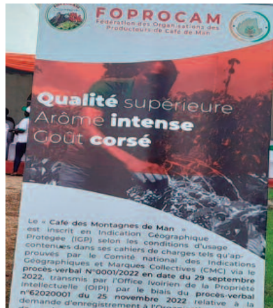
Le Café des montagnes de Man, le premier produit agroalimentaire labellisé de Côte d'Ivoire

Une bataille qui ne fut pas de tout repos. Selon les responsables de la FOPROCAM, il a fallu démontrer, par des arguments irréfutables et le constat d'une expertise nationale et internationale, ainsi que la mise sur pied d'une parfaite organisation bien hiérarchisée, que le café des montagnes de Man est non seulement produit dans des meilleures conditions, mais mieux, est de meilleure qualité. Il présente les garanties d'une production qui respecte l'environnement et pour laquelle aucun enfant n'est sollicité.