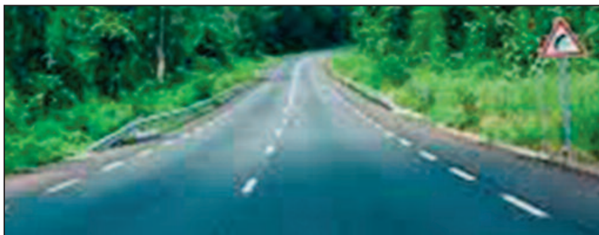
D'une éclatante beauté noire d'ébène avec ses bandes blanches qui augurent d'agréables déplacements et voyages