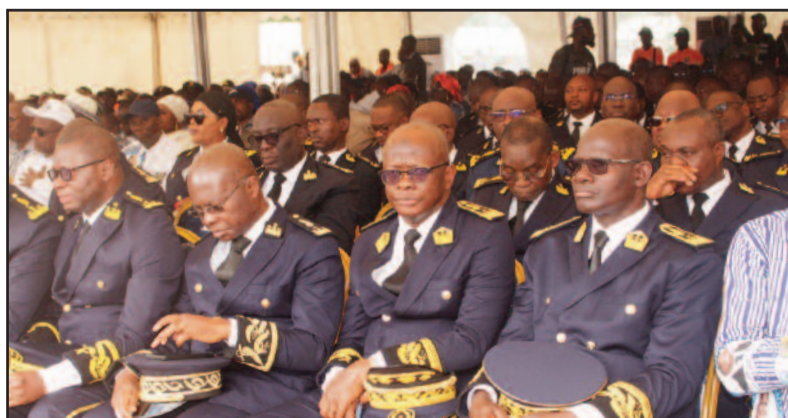
Bien présent, le corps préfectoral dans son impeccable tenue d'apparat.

commune de Man où il a eu plusieurs séances de travail avant de rallier Guiglo.