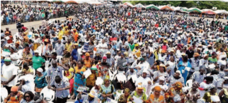
Un monde fou a déferlé à Guiglo!

Combien étaient-ils ? Les chiffres ne sont pas assez exacts pour témoigner de la grande mobilisation exceptionnelle des populations pour célébrer SEM. Alassane, un grand homme d'exception, selon le mot de l'Ambassadeur Claude Sahi Soumahoro.