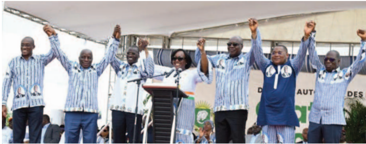
L'union des illustres fils et filles du district.

Raison pour laquelle, dans leur message, lu pour la circonstance par la présidente de la région du Cavally qui, pour cause de célébration du Président Alassane Ouattara, est devenue la capitale du District Autonome des Montagnes, ils ont d'abord rappelé ce qu'était le District Autonome des Montagnes, il y a encore quelques