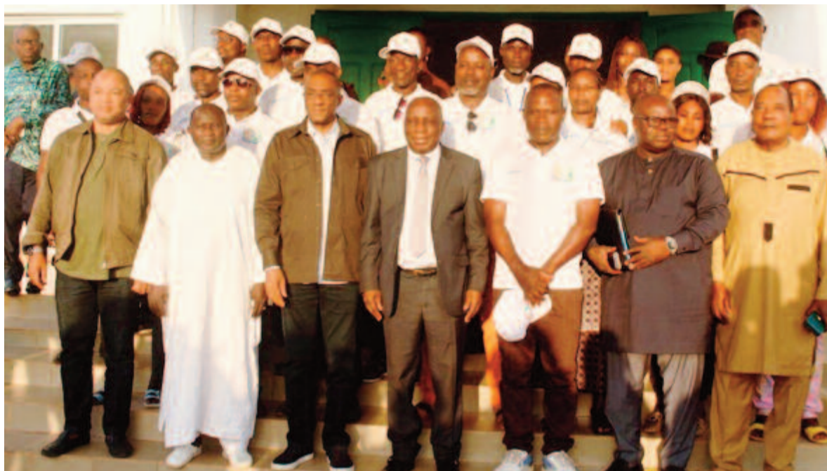
Photo de famille de la rencontre des hommes et femmes de paix à l'occasion de la journée nationale de la paix.