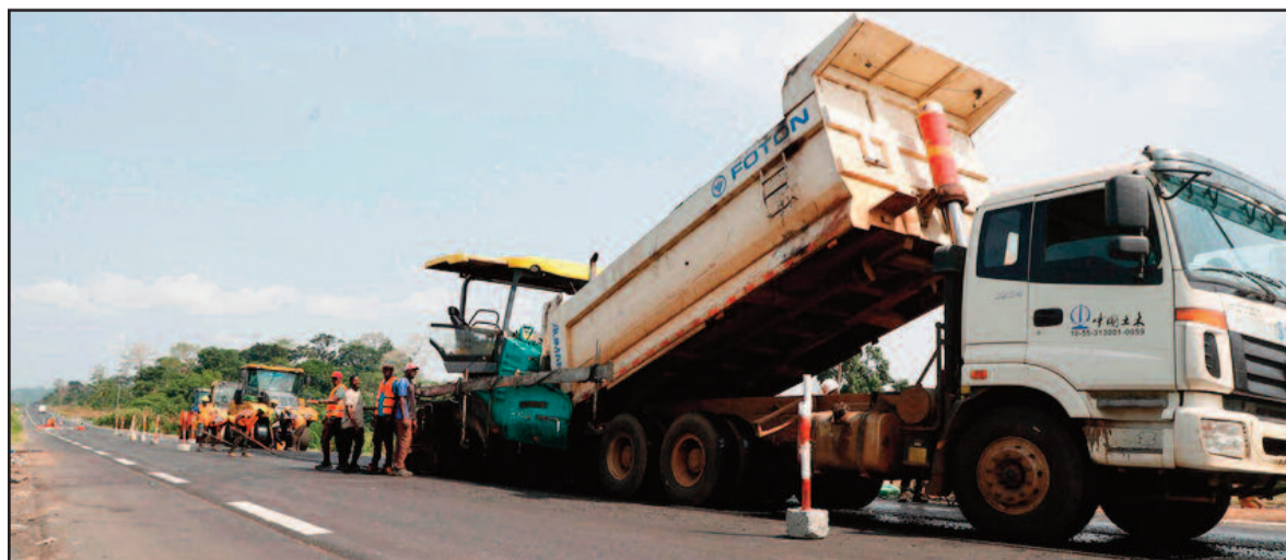
Les routes de l'Ouest se sont considérablement transformées.