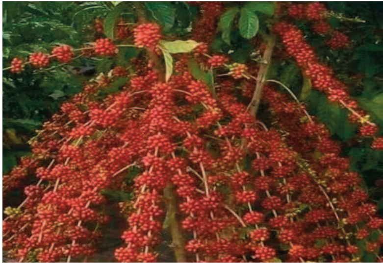
Le Café des montagnes de Man, un produit authentique

En Côte d'Ivoire, on produit généralement le café Robusta. Cependant, celui des montagnes de Man, du fait de sa production en hauteur, présente de fortes caractéristiques de l'arabica qui est le meilleur café produit dans le monde entier. D'où, le combat de la FOPROCAM qui a réussi la labélisation du café des montagnes de Man. Une merveille à découvrir !