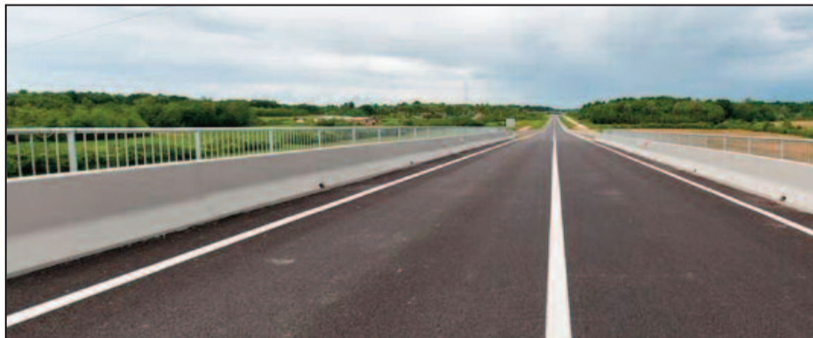
De Duékoué à Man, la voici, la route, belle et sans bavure.

De Duékoué à Man. De Man à Danané. De Danané à la frontière de la Guinée. De Danané à Zouhan-hounien. De Duékoué à Guiglo... la voici, la route. Celle qui précède le développement. Belle, elle est ! Sans bavure, ni fioriture, constate-on. D'une éclatante beauté noire d'ébène avec ses bandes blanches qui augurent d'agréables déplacements