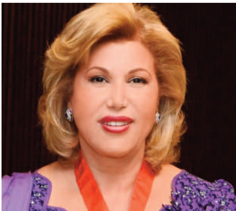
La Première Dame Dominique Ouattara reçoit le Grand Prix spécial de figure emblématique de la charité et de la solidarité.

Le jury est à pied d'œuvre et a déjà identifié les lauréates qui exercent dans tous les secteurs d'activités comme la gestion hôtelière avec