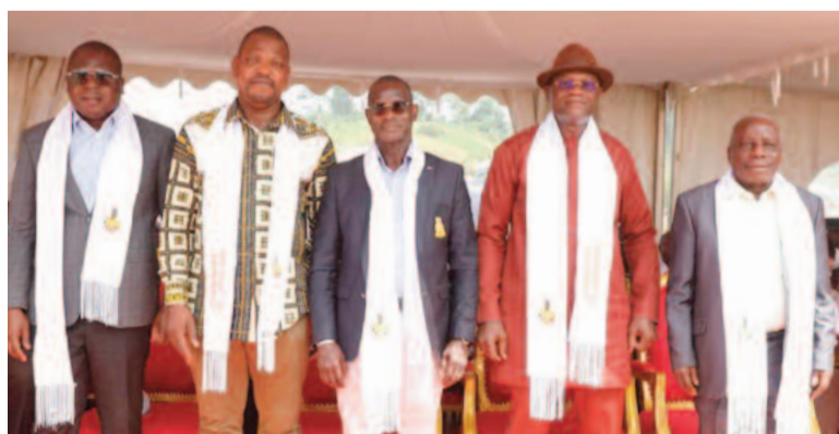
Les illustres personnalités présentes à l'intronisation du chef du canton Santa.