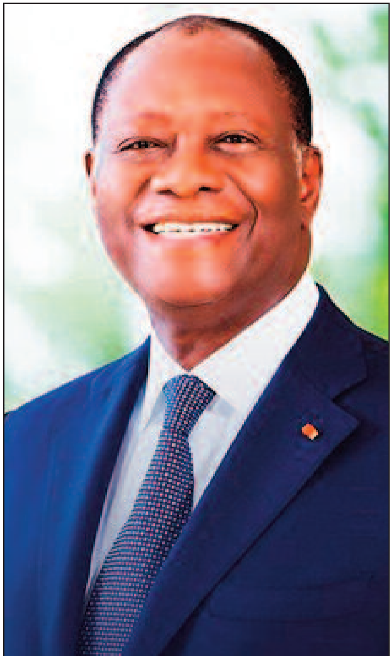
Le Président Alassane Ouattara, l'artisan de l'oeuvre de transformation du District Autonome des Montagnes

C'est désormais, le spectacle auquel l'on assiste dans le District Autonome des Montagnes à partir du village de Guéhiébly, porte d'entrée de cette entité administrative, après le nouveau pont qui surplombe le fleuve Sassandra à quelques encablures de la localité de Guessabo dans la région du Haut-Sassandra.